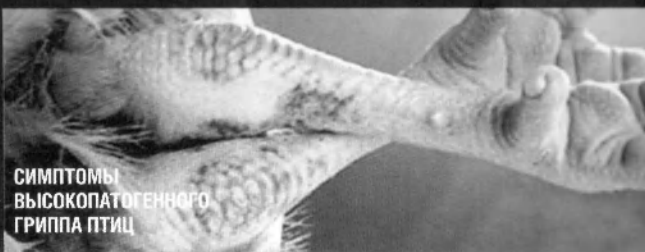
СИМПТОМЫ ВЫСОКОПАТОГЕННОГО ГРИППА ПТИЦ

7. Содержать территории и строения для содержания птицы в чистоте. Насест и гнезда побелить дважды (с интервалом в 1 час) свежегашеной известью.