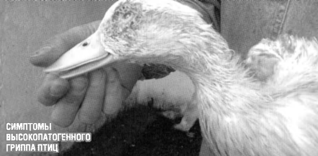
СИМПТОМЫ ВЫСОКОПАТОГЕННОГО ГРИППА ПТИЦ