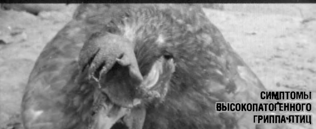
СИМПТОМЫ ВЫСОКОПАТОГЕННОГО ГРИППА ПТИЦ